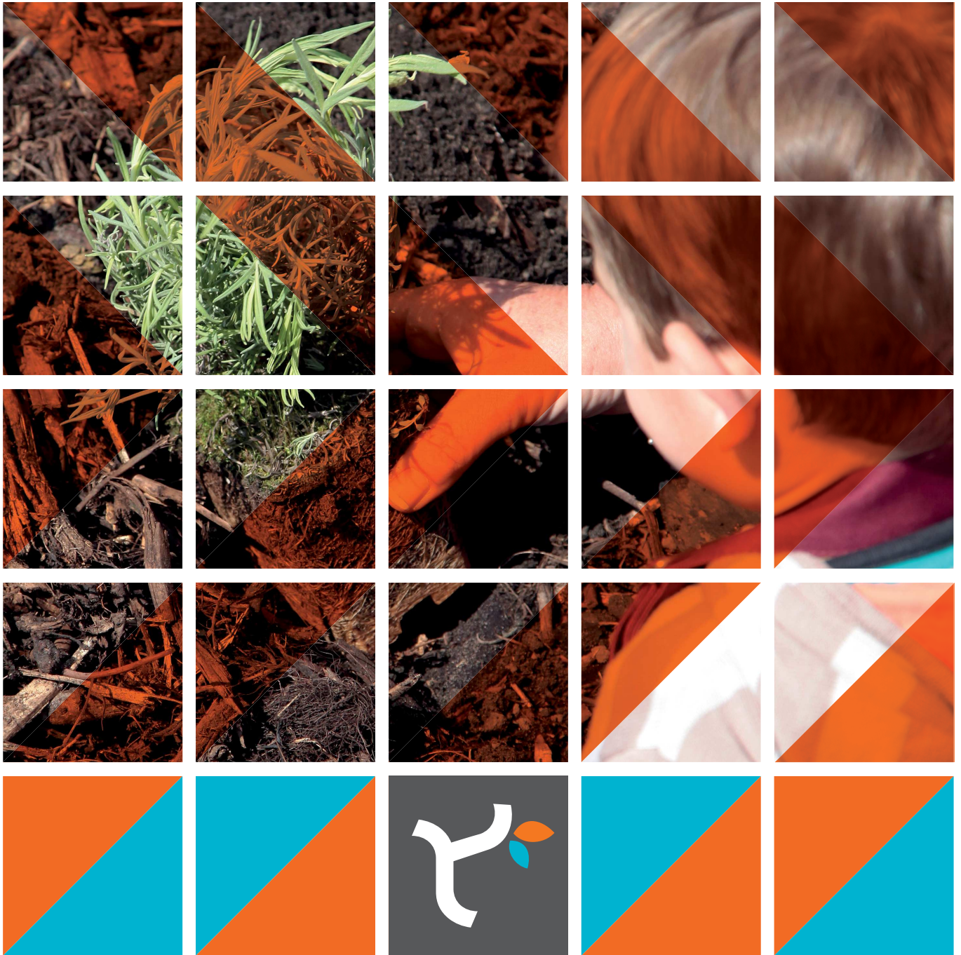
Schéma de Promotion des Achats Socialement et Écologiquement Responsables (SPASER)