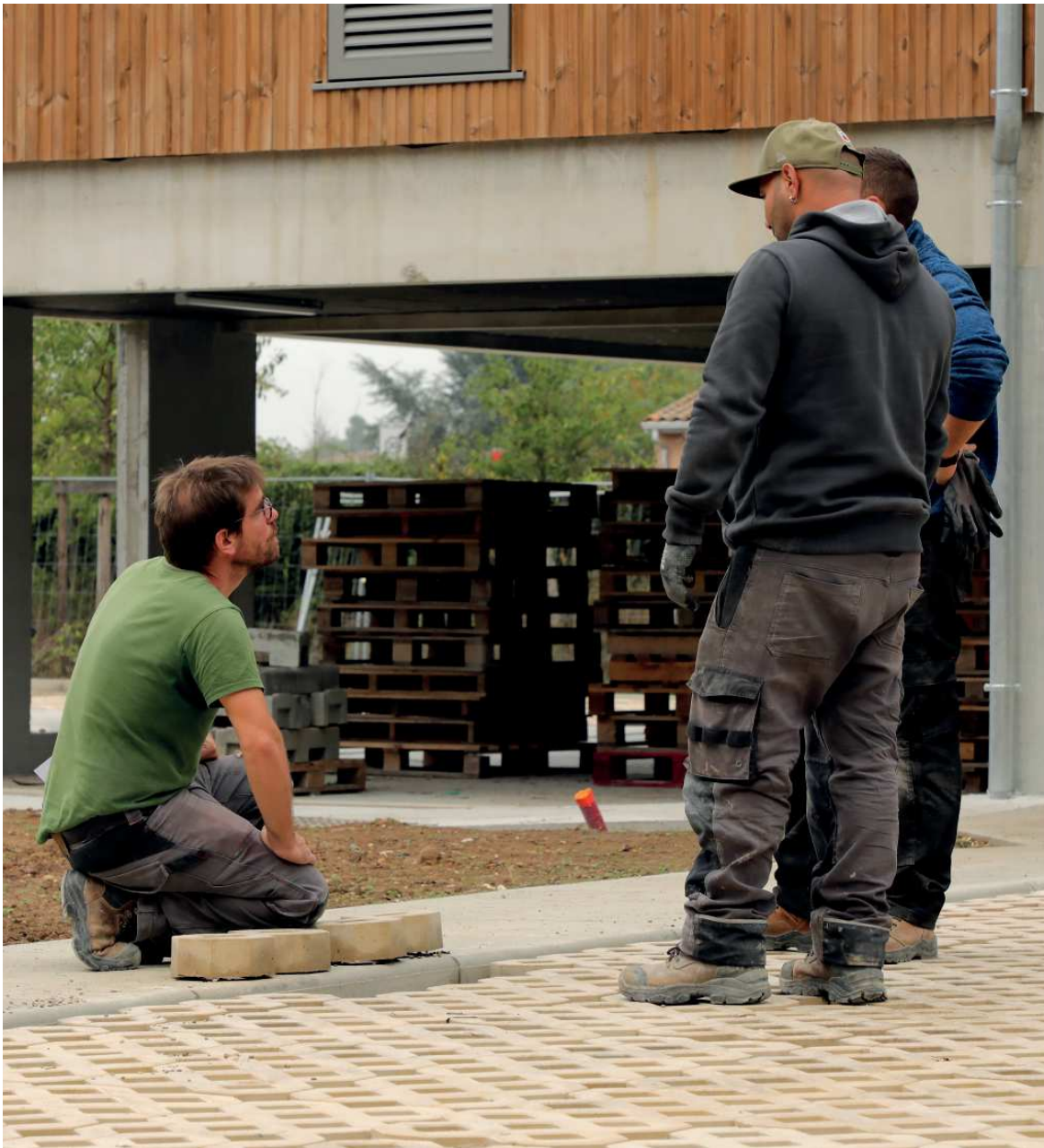
Pose de dalles alvéolées en béton d'argile crue d'origine locale, résidence Libéo à Ambarès-et-Lagrave en octobre 2022